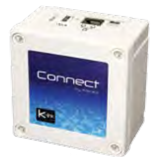
► Kit Klereo Connect

Avec le kit Klereo Connect optionnel, le Mini Klereo et le Kompact M9 se connectent à internet sur une interface ergonomique, pour piloter le dispositif à distance depuis un ordinateur, un Smartphone ou une tablette,