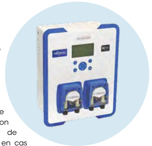
► Kompact M9 SPA

La seconde nouveauté est le Kompact M9 Hybride , un système breveté combinant électrolyse au sel et injection automatique de chlore liquide, en cas d'insuffisance de la production de chlore par électrolyse.